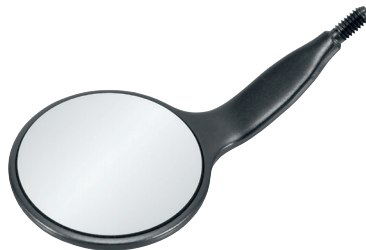
Fig. 4, 22 mm